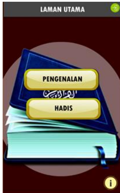
Rajah 1: Laman utama aplikasi mobil syajarat al-asanid

Rajah 2 menunjukkan kandungan yang terdapat di dalam pengenalan yang mengandungi objektif aplikasi ini dibangunkan. Manakala Rajah 3 menunjukkan pilihan yang boleh diakses oleh pengguna untuk pergi ke hadis-hadis yang terkandung di dalam aplikasi tersebut. Bilangan keseluruhan hadis di dalamnya ialah 9 hadis.