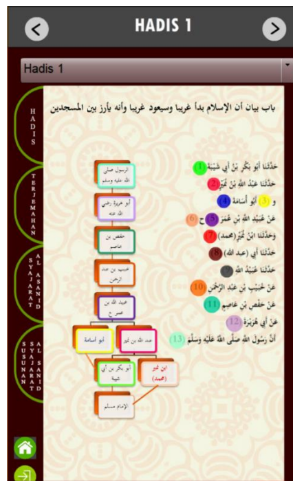
Rajah 4: Syajarat al-Asanid untuk hadis yang pertama

hadis, sanad lengkap, dan matan hadis. Matan hadis ditulis dalam bahasa Arab, dan terjemahannya dalam bahasa Melayu juga disediakan. Terdapat nombor dengan warna yang berbeza menunjukkan perawi sanad mengikut turutan dan membentuk sebuah diagram yang disebut syajarat al-asanid. Diagram yang terhasil ini adalah hasil utama bagi memahami susur galur sanad dalam periwayatan sesebuah hadis.