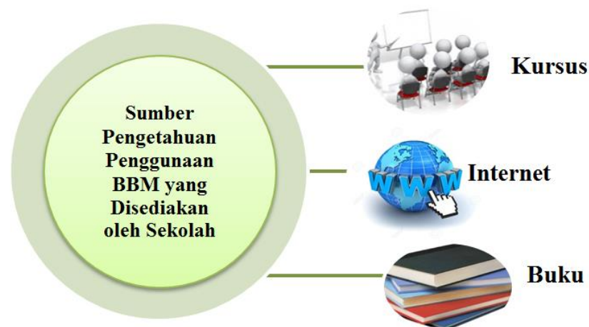
Rajah 2: Pola Dapatan Kajian bagi Sumber Pengetahuan GPI semasa Penggunaan BBM.

Sumber buku pula diwakili oleh GPI di SA, SB, dan SC. Buku yang digunakan oleh GPI adalah disediakan di sekolah untuk menambah pengetahuan tentang penggunaan BBM (GPISA, 2012: 348). Pengetahuan GPI diperolehi melalui pembacaan buku-buku yang berkaitan dengan aplikasi pelbagai jenis BBM yang sekolah perolehi dari pasaran (PYSB, 2012: 172; GPISB, 2012: 674; GPISC, 2012: 376). Secara keseluruhannya, amalan penggunaan yang mencapai tahap pola dapatan kajian ini ditunjukkan pada Rajah 2.